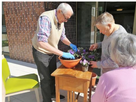
Frühling lässt sein blaues Band...

Die WG ist, Gott sei Dank, auch weiterhin coronafrei, worüber alle sehr erleichtert sind. Nach den Wintermonaten mit allerlei Gemütsschwankungen sorgten dann die ersten warmen Frühlingstage für eine bemerkenswerte Aktivität der Bewohner*innen! Die Frühlingsbepflanzung für Terrasse und Garten stand auf dem Plan. Mit großer Begeisterung und Tatkraft wurde gestaltet, gepflanzt und gegossen - Die wieder neu geweckten Lebensgeister waren deutlich sicht- und auch spürbar!