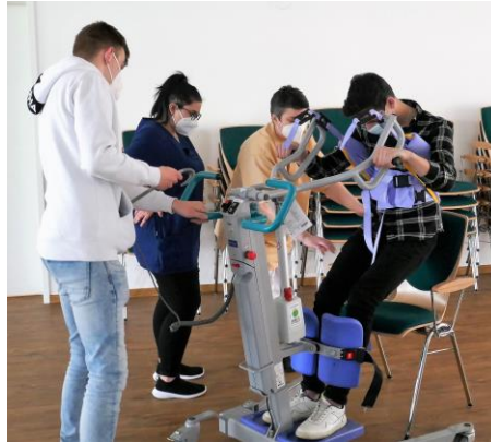
Ein Transfer mit Stehlifter im Selbstversuch

gelungener Tag für alle Beteiligten, und sicher auch für die Pflege. Es wird bestimmt nicht der letzte Bewerbertag gewesen sein. Sehen Sie hier einige Impressionen dieses aufschlussreichen Tages: