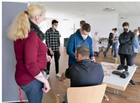
Blutdruck messen – Wie geht das?