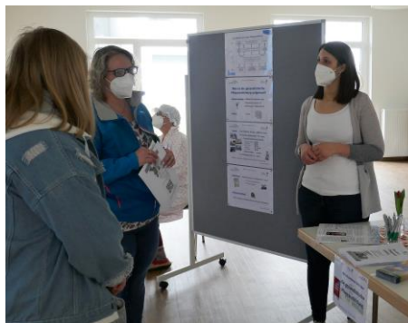
Informationen rund um die Pflegeausbildung