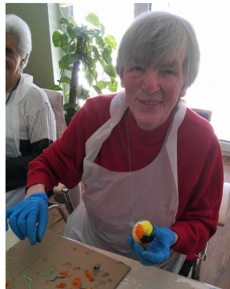
Eier einmal anders: Mit buntem Krepppapier

Wenn man nicht wüsste, dass Ostern vor der Türe steht, wäre es spätestens nach einem Blick in unsere Tagespflege jedem sofort klar! Es wurden eifrig jede Menge Eier dekoriert, kleine Seifen hergestellt und Lavendelkissen befüllt.